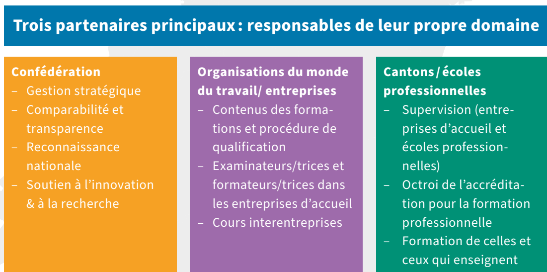
Fig. 2: Paysage de la formation professionnelle

La HEFP fait partie du paysage de la formation professionnelle en tant que centre de compétences de la Confédération doté d'une personnalité juridique propre. Ses tâches englobent la formation et la formation continue des responsables de la formation professionnelle ainsi que d'autres acteurs et actrices de la formation professionnelle, l'accompagnement et la mise en œuvre des réformes et révisions des professions ainsi que la recherche en formation professionnelle. La HEFP s'acquitte des tâches définies aux art. 48 et 48a de la loi fédérale du 13 décembre 2002 sur la formation professionnelle (LFPr).